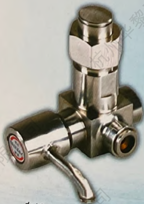
自清洗高温高压过滤器

特点：采用了样水预冷技术，可延长高温高压排污阀门寿命。采用棒针式减压阀，实现在线连续调节压力和流量。导流式冷却器，冷却效率高。高压反冲洗过滤器，防止减压阀堵塞，可排污自冲洗。